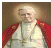
SAINT PIE X